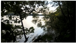
Pointe du Bois des Petits Fours